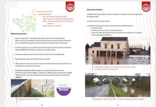
Suite du Chapitre Inondation