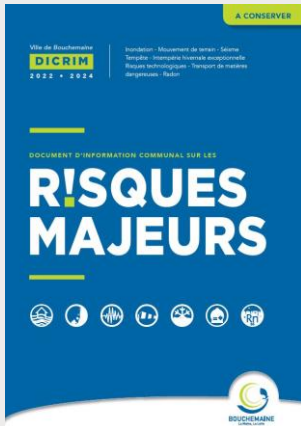
Page de garde